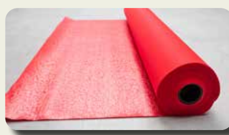
Loper / eventtapijt

200 x 100 x 40 cm €9 / stuk 9 in stock Ecrú afboording- €1/m Trede- €2/stuk- 1 in stock