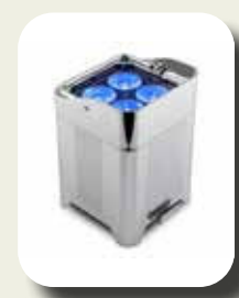
Uplighters Well Fit Pro (batterij)