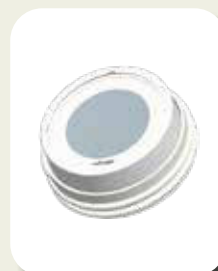
Led Light Conic (batterij)