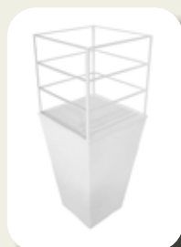
Shelf Conic 'We Taste'