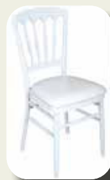
Stoel Napoleon + kussen