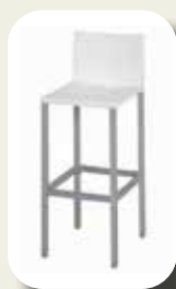
Barstoel Liberty White