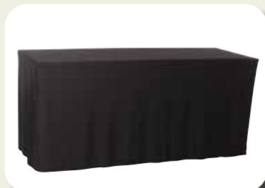
Buffettafel Hoog + Hoes