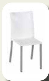
Stoel Lounge White