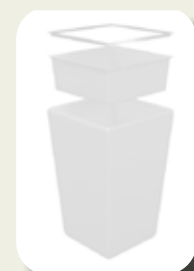
Conic Inzetframe voor open bar