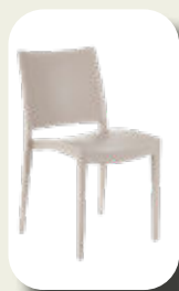
Stoel Lounge Mokka