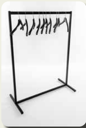
Vestiairerek + kapstokken