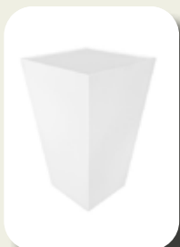
Statafel Conic White